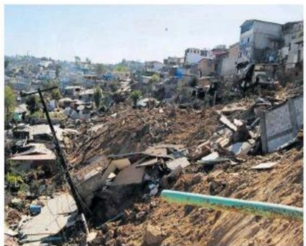
Los derrumbes en la colonia Lomas del Rubí se registraron en febrero de 2018