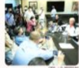
MEXICALI.- Como interesante y seguro el programa de regularización de autos chocoletas, señalan Jaime Bonilla y Mario Escobedo.

MEXICALI.- El gobernador Jaime Bonilla Valdez, junto con el secretario de economía Mario Escobedo Carrigan anunciaron que están avanzadas las negociaciones y dio como un hecho que habrá un programa de regularización de autos chocoletas. Informaron que tendrán un costo por unidad de 3,600 pesos.