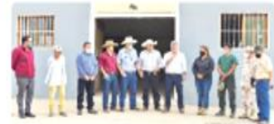
Las Sierra de Juárez y San Pedro Mártir son el pulmón de oxígeno más importante de BC. Ruiz Uribe